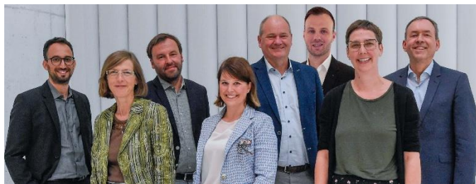
Comité directeur 2021/22

Nous espérons vous compter parmi nous pour une AG intéressante.